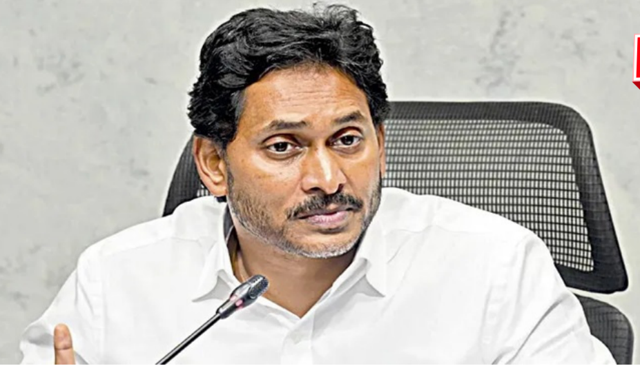
అమరావతి : వైసీపీ ఇప్పుడు నడిరోడ్డుపైకి చేరింది. నాలుగు రోడ్ల జంక్షన్ లో నిలబడింది. జీరో నుంచి ప్రస్థానం ప్రారంభించే పరిస్థితి వచ్చిందని చెప్పుకొన్నా ఆశ్చర్యం లేదు. పార్టీకి ఓటమి ఎదురు కావడం.. మిగతా..2లో

జీరో బెస్ట్ పాలిటిక్స్ దిశగా జగన్..! 2 జీరో నుంచి ప్రస్థానం ప్రారంభించే పరిస్థితి వచ్చిందని చెప్పుకొన్నా ఆశ్చర్యం లేదు మించిన స్థాయిలో నాయకులు జంప్ చేస్తుండడం మరో పెద్ద విషాదం రాజకీయంగా.. వైసీపీ మరో కమ్యూనిస్టు పార్టీమాదిరిగానో.. కాంగ్రెస్ పార్టీగానో మిగిలిపోతుంది