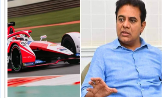
హైదరాబాద్ : ఫార్ములా ఈ-కార్ కేసులో బీఆర్ఎస్ వర్కయింగ్ మెన్బర్ కేటీఆర్ కు ఈడీ నోటీసులు జారీ చేసిన సంగతి తెలిసింది. దీనిపై కేటీఆర్ ఆసక్తికర వ్యాఖ్యలు చేశారు. అవినీతి లేనప్పుడు కేసు ఎక్కడిదని ఆయన ప్రశ్నించారు.

ఫార్ములా-ఈ కేసులో పస లేదు... అదొక లొట్టపీసు కేసు: కేటీఆర్ 2 అవినీతి లేనప్పుడు కేసు ఎక్కడిదన్న కేటీఆర్ ఏదో ఒక రకంగా తనను జైలుకు పంపాలని చూస్తున్నారని మండిపాటు స్థానిక సంస్థల ఎన్నికల్లో సత్తా చూపిస్తామని ధీమా