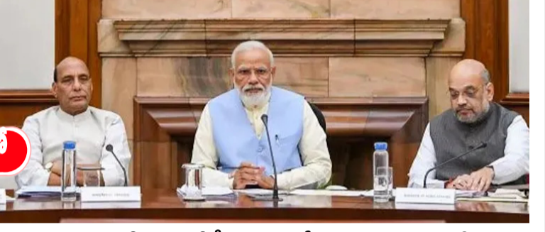
2025 తొలి కేబినెట్ భేటీని ప్రధాని మోదీ రైతులకు అంకితం చేశారన్న కేంద్రమంత్రి ఫుసల్ బిమా యోజనకు కేటాయింపులను రూ.69 వేల కోట్లకు పెంచుతూ కేబినెట్ ఆమోదం డిపీపీ ఎరువుల బస్టాను రూ.1,350కే రైతుకు అందించే పథకం పొడిగింపుకు ఆమోదం

2025లో కేంద్ర కేబినెట్ తొలి సమావేశం... రైతుల కోసం కీలక నిర్ణయాలు! 2 2025 తొలి కేబినెట్ భేటీని ప్రధాని మోదీ రైతులకు అంకితం చేశారన్న కేంద్రమంత్రి ఫుసల్ బిమా యోజనకు కేటాయింపులను రూ.69 వేల కోట్లకు పెంచుతూ కేబినెట్ ఆమోదం డిపీపీ ఎరువుల బస్టాను రూ.1,350కే రైతుకు అందించే పథకం పొడిగింపుకు ఆమోదం