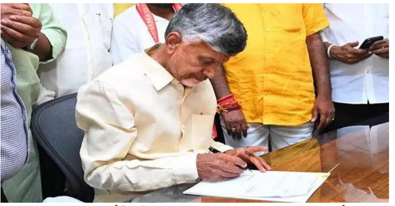
అమరావతి : ఆంధ్రప్రదేశ్ రాష్ట్రానికి 2025 నూతన సంవత్సరం ఓ ప్రత్యేక శుభారంభంగా మారింది. ముఖ్యమంత్రి నారా చంద్రబాబు నాయుడు నూతన సంవత్సరంలో తన తొలి సంతకాన్ని ప్రజల ప్రయోజనానికి అంకితమిచ్చారు.

నూతన సంవత్సరంలో ఏపీ సీఎం చంద్రబాబు తొలి సంతకం 2 తొలి సంతకంతో 1,600 మంది దరఖాస్తుదారులకు రూ. 24 కోట్ల మేర నిధులు విడుదల చేసింది. డింబో 7,523 మంది పేద వర్గాలకు లబ్ధి చేకూరింది. 2025 నూతన సంవత్సరంలో ప్రభుత్వం ప్రజల కోసం మరొక్క సంక్షేమ కార్యక్రమాలు చేపట్టాలని లక్ష్యం ఎత్తివేసి కౌటమి ప్రభుత్వం అధికారంలోకి వచ్చాక లబ్ధి పొందిన వారి సంఖ్య 9,123 ముఖ్యమంత్రి చంద్రబాబు నాయుడు మరో మొదలైన మార్గదర్శకత్వం చూపించారని కూటమి నేతలు