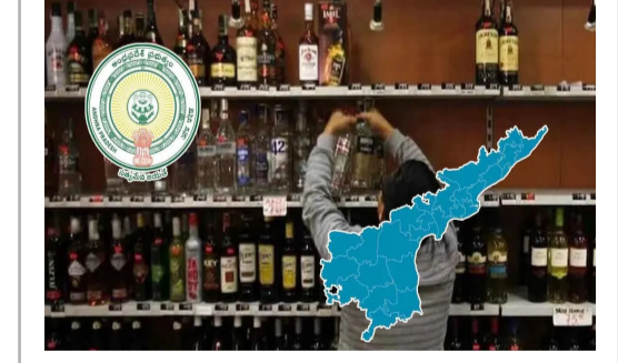
అమరావతి : గౌడ, తెల్లి బలిజ, ఈడిగ, గామల్లు, కలారి, క్రీసాయన, శెగడి, గొండ్ల, బలిజ, యాత, సోదీ వంటి కులాలకు 10 శాతం రిజర్వేషన్ కింద షాపులు కేటాయిస్తారు. షాపులను ఆక్టోబర్ 6న ఆయా కులాల సంఖ్య ఆధారంగా వారికి కేటాయిస్తారు. ఇందుకోసం ప్రభుత్వం మార్గదర్శకాలను విడుదల చేసింది. ఒక్కొక్కరు ఎన్ని షాపుల కోసం అయినా ఫీజు చెల్లించి ధరఖాస్తు చేసుకోవచ్చు. అయితే ఒక వ్యక్తికి ఒకటి షాపు కేటాయిస్తారు. ఈ షాపుల కాలవరిమిలి 2026 సెప్టెంబర్ 30 వరకు ఉంటుంది. దీనిపై ఇప్పటికే కనరత్తు పూర్తి చేసిన అధికారులు ఆ వివరాలను సీఎం ముందు ఉంచారు. అన్ని పరిశీలించిన ముఖ్యమంత్రి నోటిఫికేషన్ కు గ్రీన్ సిగ్నల్ ఇచ్చారు. మధ్యం రిటైల్ షాపులకు ఇప్పటి మార్కెటింగ్ కూడా పెంచుతూ ముఖ్యమంత్రి నిర్ణయం తీసుకున్నారు. ఇప్పటి వరకు మధ్యం షాపులకు 10.5 శాతం మార్కెట్ ఇస్తున్నారు. దీని పట్ల తాము నష్టపోతున్నామని.. మిగతా..2లో

చంద్రబాబు సర్కార్ కీలక నిర్ణయం.. మలిన్న మధ్యం షాపులకు గ్రీన్ సిగ్నల్ 2 అమరావతి : గౌడ, తెల్లి బలిజ, ఈడిగ, గామల్లు, కలారి, క్రీసాయన, శెగడి, గొండ్ల, బలిజ, యాత, సోదీ వంటి కులాలకు 10 శాతం రిజర్వేషన్ కింద షాపులు కేటాయిస్తారు. షాపులను ఆక్టోబర్ 6న ఆయా కులాల సంఖ్య ఆధారంగా వారికి కేటాయిస్తారు. ఇందుకోసం ప్రభుత్వం మార్గదర్శకాలను విడుదల చేసింది. ఒక్కొక్కరు ఎన్ని షాపుల కోసం అయినా ఫీజు చెల్లించి ధరఖాస్తు చేసుకోవచ్చు. అయితే ఒక వ్యక్తికి ఒకటి షాపు కేటాయిస్తారు. ఈ షాపుల కాలవరిమిలి 2026 సెప్టెంబర్ 30 వరకు ఉంటుంది. దీనిపై ఇప్పటికే కనరత్తు పూర్తి చేసిన అధికారులు ఆ వివరాలను సీఎం ముందు ఉంచారు. అన్ని పరిశీలించిన ముఖ్యమంత్రి నోటిఫికేషన్ కు గ్రీన్ సిగ్నల్ ఇచ్చారు. మధ్యం రిటైల్ షాపులకు ఇప్పటి మార్కెటింగ్ కూడా పెంచుతూ ముఖ్యమంత్రి నిర్ణయం తీసుకున్నారు. ఇప్పటి వరకు మధ్యం షాపులకు 10.5 శాతం మార్కెట్ ఇస్తున్నారు. దీని పట్ల తాము నష్టపోతున్నామని.. మిగతా..2లో