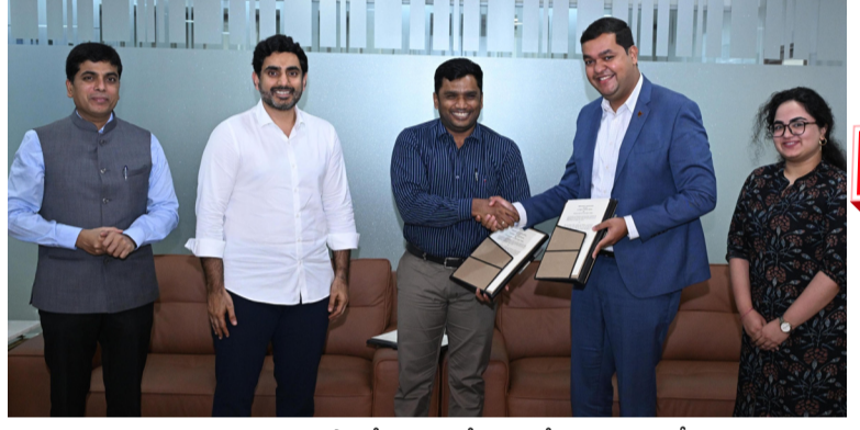
అమరావతి : అధునాతన సాంకేతిక వేయడంలో భాగంగా ఏపీ ప్రభుత్వం రెండు అవిష్కరణల కేంద్రంగా ఎడిగోందుకు అడుగులు వేస్తున్న ఆంధ్రప్రదేశ్ లో డీప్-టెక్ ను అభివృద్ధి చేయడంలో భాగంగా ఏపీ ప్రభుత్వం రెండు ప్రధాన సంస్థలతో కీలక ఒప్పందాలు చేసుకుంది. రాష్ట్ర ఐటీ, ఎలక్ట్రానిక్స్, ఏప్రిల్..26

ఏపీ ప్రభుత్వంతో కలిసి పనిచేయనున్న ఫిజిక్స్ వాలా, టీబీఐవ మంత్రి నారా లోకేశ్ నివాసంలో ఒప్పందాలపై సంతకాలు ప్రపంచస్థాయి ప్రమాణాలతో యువతకు శిక్షణ లక్ష్యమన్న నారా లోకేశ్