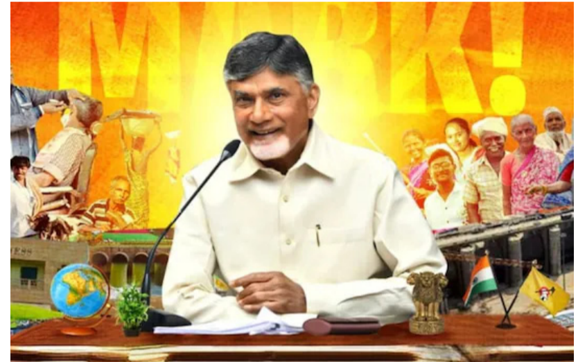
అమరావతి : ముఖ్యమంత్రి అయిన తరువాత దా దాపు అయిదు నెలలు దగ్గర పడుతున్న నేపథ్యంలో చంద్రబాబు ఉత్తరాంధ్రా పర్యటనను పెట్టుకున్నారు. ఆయన నవంబర్ 1, నవంబర్ 2 తేదీలలో