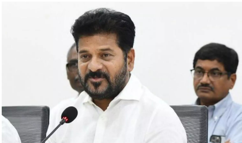
హైదరాబాద్ పార్టీ విధానమే ప్రభుత్వ విధానమని తెలంగాణ ముఖ్యమంత్రి రేవంత్ రెడ్డి స్పష్టం చేశారు. పార్టీ ఇచ్చిన మాటకు.. ప్రభుత్వం తప్పకుండా నిలబడుతుందన్నారు.