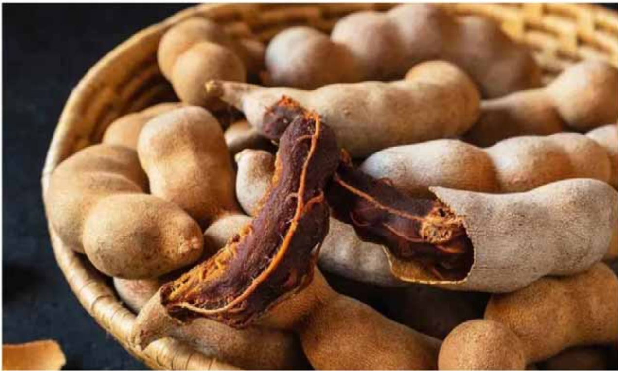
చింతపండు ఎక్కువగా తీసుకోవడం వల్ల జీర్ణ సంబంధిత సమస్యలు తలెత్తడంతో పాటు వాంతులు విరోచనాలు అయ్యే అవకాశాలు కూడా ఎక్కువగా ఉంటాయని చెబుతున్నారు.

మారతాయని చెబుతున్నారు. చింతపండులో టానిన్ లతో సహా అనేక సమ్మేళనాలు ఉంటాయి. వీటిని జీర్ణం చేసుకోవడం కొంచెం కష్టం. అధిక పరిమాణంలో చింతపండు తీసుకుంటే, కడుపు, జీర్ణశయాంతర ప్రేగులలో యాసిడ్ స్టాయిని పెంచుతుంది. ఇది గ్యాస్, యాసిడ్ రిఫ్లక్స్, ఇతర కడుపు సమస్యలను కలిగిస్తుందని చెబుతున్నారు. చింతపండును అధిక మోతాదులో తీసుకోవడం వల్ల శరీరంలో ఇడ్ ఫుగర్ లెవల్స్ తగ్గుతాయట. మైకం, బలహీనత ఆవహిస్తాయి. గ్లూకోజ్ స్థాయిలను తగ్గించడానికి ఇప్పటికే మందులు వాడుతున్న వారు చింతపండు తీసుకోవడం అంతమంచిది కాదు. అలాగే గర్భధారణ సమయంలో చింతపండుకు దూరంగా ఉండటం మంచిదని చెబుతున్నారు. ఎందుకంటే గర్భిణీ స్త్రీలు చింతపండు ఎక్కువగా తీసుకోవడం అంత మంచిది కాదట. దీన్ని ఎక్కువగా తింటే శరీరంలో ఉష్ణోగ్రత పెరుగుతుంది. ఇది కడుపులో పెరుగుతున్న శిశువుపై ప్రభావం చూపుతుందట. అంతేకాదు చెబుతున్నారు. పాలిచ్చే తల్లులు కూడా చింతపండు తినకూడదని చెబుతున్నారు.