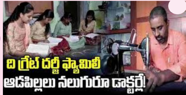
బ గ్రేట్ దర్జీ ఫ్యాషిబి ఆడపిల్లలు నలుగురూ డాక్టర్లే!