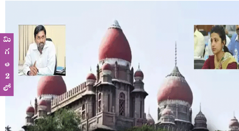
కేంద్రం ఇటీవల బదిలీ చేసిన ఐఎఎస్ తెలంగాణ హైకోర్టులో లంబ్ మోషన్ పిటిషన్ దాఖలు చేసిన సంగతి తెలిసిందే. ఐఎఎస్ అధికారులు రొనాల్డ్ ఊరట దక్కలేదు. క్యాట్ తీర్పును సవాల్ చేస్తూ ఏడుగురు ఐఎఎస్ అధికారులు తెలంగాణ హైకోర్టులో లంబ్ మోషన్ పిటిషన్ దాఖలు చేశారు.