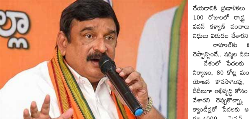
రాష్ట్రంలో వికసిత ఆంధ్ర వైపు ప్రయాణం సుస్పష్టంగా కనిపిస్తుందన్నారు. ప్రధాని మోడీ దేశంలో 15 లక్షల కోట్ల యోజిక సమాచారాల లక్ష్యాన్ని 100 రోజుల్లో మూడు లక్షల కోట్ల నిమగ్నలకు అంతుకార్చాలనే ప్రకారం తెలిపారు. 100 రోజుల్లో సీఎం చంద్రబాబు నాయుడు అమరావతి, పోలవరం నిర్మాణం పూర్తి

ప్రభుత్వం కృషి చేస్తుందని విష్ణుకుమార్ రాజు వెల్లడించారు. రాజురాన్ని పిమ్మట్రాం. ఎమ్మెల్యే కామినేని శ్రీనివాస్ బుడమేరు వరద ఉద్యమంలో సప్లయ్ పథకం బాధితులను ఆదుకునేందుకు కూటమి ప్రభుత్వం నిర్ణయం తీసుకుంటుందని ఎమ్మెల్యే కామినేని శ్రీనివాస్ తెలిపారు. సప్లయ్ పథకం బాధితులు, అలాగే రైతులకు తగిన న్యాయం చేస్తామని భరోసా ఇచ్చారు. రాజధాని ప్రాంతం వరద ముప్పుకు గురవుతుందని కొందరు విష ప్రచారం చేస్తున్నారని మండిపడ్డారు. రాజధాని ప్రాంతంలో అలాంటి ఇబ్బందులు ఉండవని స్పష్టం చేశారు. గత ఐదు సంవత్సరాలలో రాష్ట్రాన్ని అభివృద్ధి చేయడంగా వైసీపీ మాటలతో మోసం చేసినదని ఎమ్మెల్యే మండిపడ్డారు. 100 రోజుల్లో ఎన్టీ.. : లంకా దినకర్ ప్రధాని సరేంద్ర మోడీ, సీఎం చంద్రబాబు నాయుడు 100 రోజుల అడుగులు 100 సంవత్సరాల దేశ, రాష్ట్ర భవిష్యత్తు వైపుకే ఏపీ బీజేపీ ముఖ్య అధికార ప్రతినిధి లంకా దినకర్ అన్నారు. 100 రోజుల దబల్ ఇంజన్ సర్కార్ గమనం కేంద్రంలో వికసిత భారత్,