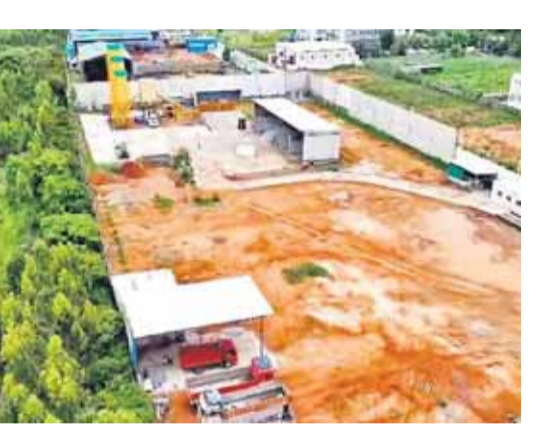
వారోపవాదాలు జరిగాయి. జులై 31న జరిగిన వాదనల్లో మున్సిపాలిటీ జులై 30న నోటీసులు ఇచ్చామని, చర్యలు తీసుకుంటామని వివరించింది. కానీ ఇంత వరకు ఎలాంటి చర్యలు తీసుకోలేదు. కానీ రేడిమిక్కు కంపెనీ మాత్రం నిర్మాణం పూర్తి చేసి, కార్యకలాపాలను అదుపుగా కొనసాగిస్తుంది. కమిషనర్ను పలుమార్లు ఈ విషయపై కలిశామని, చర్యలు తీసుకోవడంలో తాత్కాలం చేస్తున్నారని ఆర్ అండ్ డీ నిర్వాహకులు చెప్పారు. బాసరేగడిలో కామాక్కి ఆర్ఎంసీకి అనుమతులు లేవని ఫిర్యాదులు తన దృష్టికి వచ్చాయి. పరిశీలించి చర్యలు తీసుకుంటామని మున్సిపల్ కమిషనర్ స్వామి తెలిపారు.

బాస రేగడిలో కామాక్కి ఆర్ఎంసీ ఏర్పాటు చేసిన ప్రాంతానికి కేవలం 80 నుంచి 100 మీటర్ల దూరంలో జనరీడ్ మండల పరిశోధన, అభివృద్ధి కేంద్రాలు ఉన్నాయి. రెండు కంపెనీలు నాలుగైదేళ్ల నుంచి పని చేస్తుండగా మరో రెండు కేంద్రాలు పురోగతి దశలో ఉన్నాయి. నిబంధనల ప్రకారం, అన్నతలకు 500 మీటర్ల దూరంలో ఇలాంటి కంపెనీలు ఉండాలి. మండల పరిశోధన, అభివృద్ధి కేంద్రాలు కూడా అదే కోణం చెందినవని కంపెనీల నిర్వాహకులు చెబుతున్నారు. ఆర్ఎంసీ నుంచి వచ్చే దుమ్ముతో ల్యాండ్లో పరికరాలు సరిగా పని చేయకుండా ఫలితాలను తప్పగా చూపే అవకాశం ఉంటుందని వారు ఆవేదన వ్యక్తం చేస్తున్నారు.ఆర్ఎంసీని ఇక్కడి నుంచి తరలించాలని వారు అభ్యంతరం చెబుతున్నారు. హెంబులం, సీఎంపీ, మున్సిపాలిటీలకు ఫిర్యాదు చేశారు. హైకోర్టుకు కూడా వెళ్లారు. హైకోర్టు ఆదేశాల మేరకు హెంబులం స్థానిక గుండ్ల పోచంపల్లి మున్సిపాలిటీకి చర్యలు తీసుకోవాలని సూచించింది. అయితే, మున్సిపాలిటీ నోటీసులు ఇవ్వడానికి మాత్రమే పరిమితమైంది, ఎలాంటి చర్య తీసుకోవడంలేదని ఆర్ అండ్ డీ కేంద్రాల నిర్వాహకులు ఆరోపిస్తున్నారు. గతంలో ఇచ్చిన నోటీసుపై ఆర్ఎంసీ మే 27న స్టే తప్పకుండా. స్టేజ్ ఇచ్చిన నాలుగు వారాల సమయం పూర్తయిపోతూ చర్య తీసుకోకపోవడంతో మళ్ళీ నిర్వాహకులు వ్యాధిస్థానానికి వెళ్లారు.ఈ సారి పలుమార్లు కోర్టులో