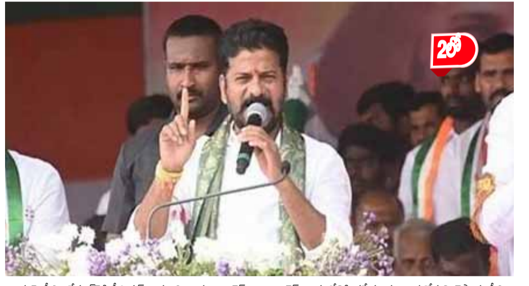
అంశంపై సీఎం రేవంత్ రెడ్డి సీరియస్ గా స్పందించారు. కాంగ్రెస్ వాళ్లు ఎవరి జోలికి వెళ్లరనీ.. అదే సమయంలో ఎవరైనా కాంగ్రెస్ వాళ్ల జోలికి వస్తే మాత్రం ఊరుకోమని చెప్పారు సీఎం రేవంత్ రెడ్డి. గాంధీ భవన్ లో డి.పీ.సి.పీ. విగత..2లో

సీఎం పదవికి కేజ్రీవాల రాజీనామా 2 1 ప్రజల ఆమోదంతోనే మళ్ళీ సీఎం పదవిని చేపడతాను' అని కేజ్రీవాల ప్రకటించారు 1 కేంద్రంలోని బీజేపీని ఢీకొట్టి మళ్ళీ ఢిల్లీ పీఠాన్ని కైవసం చేసుకుంటామని కేజ్రీవాల ఢీమాగా ఉన్నారు. 1 రాజ్యాంగంలోని అధికరణం 21 కల్పించే వ్యక్తిగత స్వేచ్ఛకు విరుద్ధమని ధర్మాసనం స్పష్టంచేసింది. ఢిల్లీ రాజకీయాలు హాట్ హాట్ గా సాగుతున్నాయి. లిక్కర్ స్వామ్ కేసులో జైలు నుంచి విడుదలైన