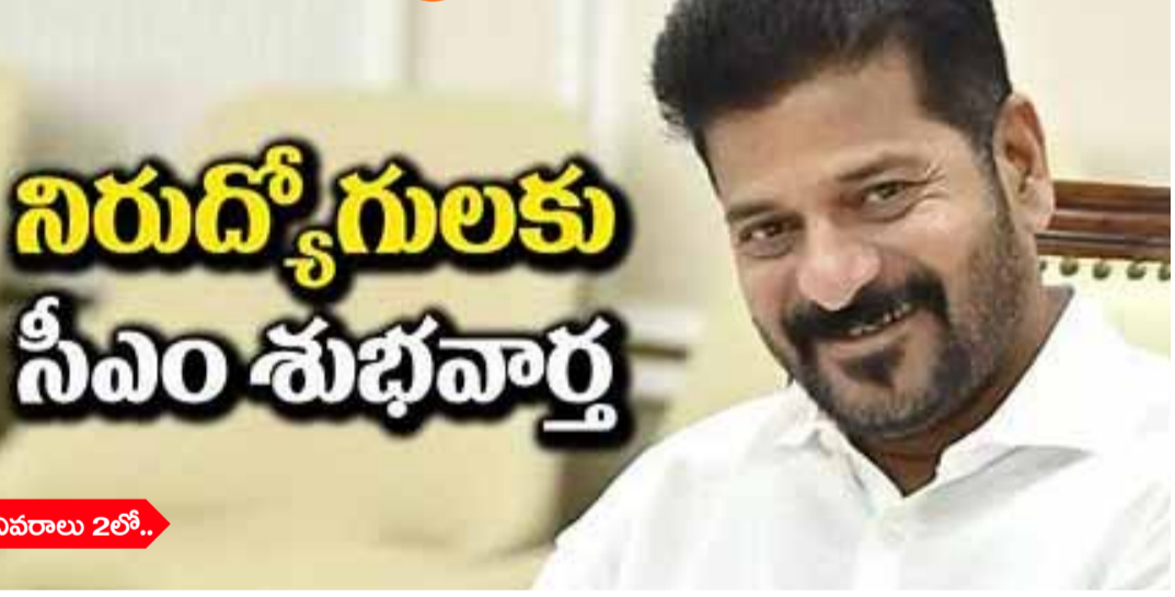
కాంగ్రెస్ అగ్రనేత రాహుల్ గాంధీ ప్రధాని తెలంగాణ సీఎం రేవంత్ రెడ్డి వ్యాఖ్యానించారు. బాధ్యతలు స్వీకరించిన మహిళా కుమార్ అయినప్పటికీ ఫైనల్ లో గెలిచినట్లు అని ఆదివారం తెలంగాణ కాంగ్రెస్ అధ్యక్ష గౌడ్ కు సీఎం రేవంత్ రెడ్డి ఆభినందనలు

కాంగ్రెస్ ప్రభుత్వం అధికారంలోకి వచ్చిన వెంటనే హామీలను అమలు చేస్తోందన్నారు సీఎం రేవంత్. వ్యవసాయ రుణం రూ.2 లక్షలకు పైగా ఉన్న రైతులు భయపడొద్దని, అందరికీ న్యాయం చేస్తామని 1994 నుంచి రాష్ట్రంలో ప్రతిపార్టీ రెండుసార్లు చొప్పున గెలిచిందని, ఒక్క ఏడాదిలోనే 65వేల నింపిన ఘనత కాంగ్రెస్ ప్రభుత్వానికే దక్కుతుందని చెప్పి కొచ్చారు. విగత..2లో