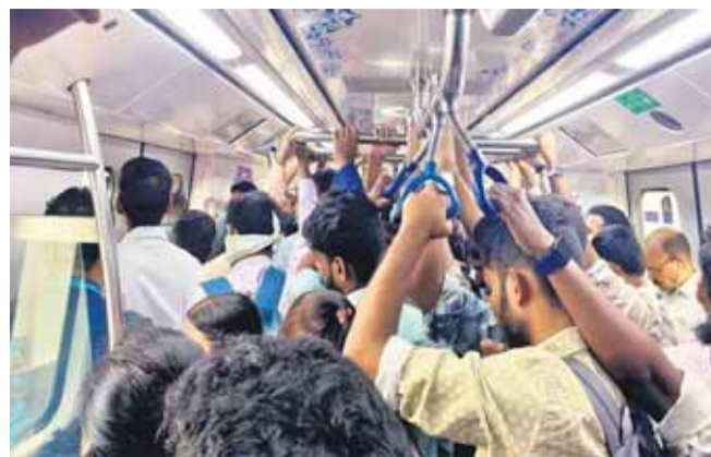
లేదు. ఏటా ప్రయాణికుల రెట్టి పేరుగుతున్నారే తప్ప.. ఎక్కడా తగ్గడం లేదు. భవిష్యత్లోనూ మరింత పెరిగే అవకాశం ఉంటుంది.అయినా

హైదరాబాద్ మహానగరంలో మెట్రో రైలు సేవలు ప్రారంభమై ఆరేండ్లు దాటింది. ప్రయాణికుల సంఖ్య గణనీయంగా పెరిగింది. ప్రతి రోజూ 5లక్షలకు పైగా నగరవాసులు మెట్రోలో ప్రయాణిస్తున్నారు. 57 కోచ్లతో 69 కి.మీ మేర సదుపాయం మెట్రో రైల్వేలో కారిడార్-2 (జేబీఎన్-ఎంజీబీఎస్) మినహా మిగతా రెండు కారిడార్లలో రద్దీ అధికంగా ఉంటున్నది. కారిడార్-1(ఎట్టిసగర్-మియాపూర్), కారిడార్-3 ( నాగోల్-రాయదుర్గ)లో మెట్రో రైల్వే ప్రయాణికులతో కిక్కిరిసిపోతున్నాయి.కనీసం నిలబడేందుకూ చోటు ఉండటం లేదు. లోపలికి ఎక్కిన తర్వాత అటు ఇటు కదలడానికి కూడా అవకాశం లేనంతగా రద్దీ ఉంటున్నది. ఈ క్రమంలోనే కొన్ని నెలలుగా 3 కోచ్లు ఉన్న మెట్రో రైల్వే బోగీలను ఆరుకు పెంచాలంటూ డిమాండ్ చేస్తున్నా ఎల్అండ్టీ పట్టించుకోవడం