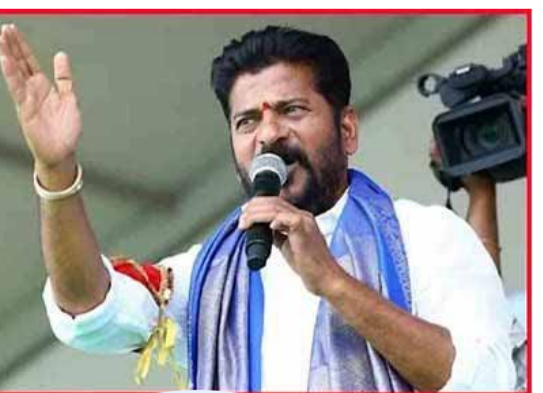
మాస్ వార్తాంగ్ త్వరలో రాష్ట్రానికి వా మేడ దాడి జరగనుంది. రీజనల్ రింగ్ రోడ్డు రాబోతుంది. తేజావం ప్రభుత్వం పార్టీ కార్యక్రమాలు జోరెత్తడం ప్రజల్లోకి అంటున్నారు. "కాంత తీసుకు వెళ్లాల్సి. రూ.10లక్షల ఆరోగ్య శ్రీ ఇచ్చి తమది మా మంచి సన్మానాలు పేదల ప్రభుత్వమని నిరూపించామని అన్నారు. మా తనం చేతగాని మన వాళ్ల కార్యకర్తల జోలికి రొవొద్దు. కార్యకర్తల జోలికి వస్తే తనం ఇంటికి వస్తాం చూస్తూ ఊరుకోం తాటతీస్తాం" అని సీఎం అనుకోవద్దు. అన్నారు. కానీ రేవంత్ రెడ్డి హెచ్చరించారు. మా పైసెడెంట్ మనవాళ్లే వారి ఇంటికి సామ్యుడే కావొచ్చు.. కానీ వెళ్లారు. ఇంటికి రమ్మన్నవారు ఇప్పుడు అతని వెనుక నేనున్నా. విగత..2లో

కేజ్రీవాల రాజీనామా ప్రకటన అనంతరం స్పందించిన అతిషి.. 2 అరవింద్ కేజ్రీవాల వారసురాలు అతిషినే అని ఓ ప్రచారం అయితే సాగుతుంది. ప్రభుత్వంలో సైతం అతిషి కీలకంగా వ్యవహరిస్తున్నారు. ఈ నేపథ్యంలో ఢిల్లీ సీఎంగా అతిషిని ఎంపిక చేస్తారని ఊహాగానాలు ఊపందుకోన్నాయి. న్యూఢిల్లీ, సెప్టెంబర్ 15: మధ్యం కుంభకోణం కేసులో