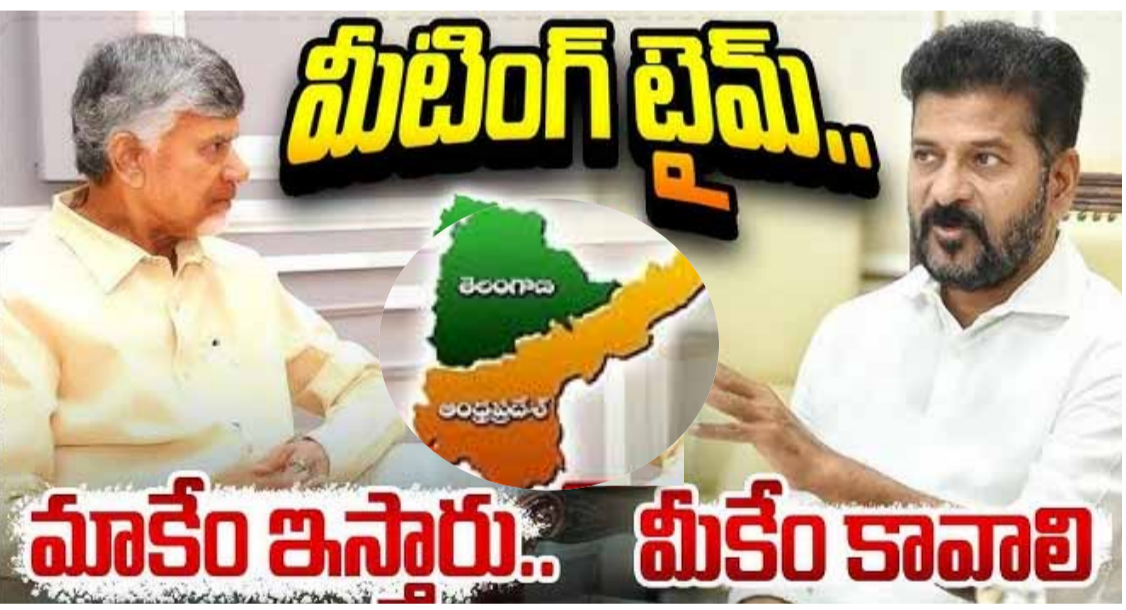
హైదరాబాద్ : ఇటీవల సుప్రీంకోర్టు వర్గీకరణ చేయాల్సిన అవసరం నమయం రాష్ట్రాలకు స్వేచ్ఛను ఇస్తూ.. సుప్రీంకోర్టు ఇచ్చిన తీర్పును అనుకూలంగా ఏపీ వర్గీకరణ చేయాల్సిన అవసరం నమయం రాష్ట్రాలకు స్వేచ్ఛను ఇస్తూ.. సుప్రీంకోర్టు రెండూ రాష్ట్రాలకు ఏర్పడ్డాయి. ఈ విషయంలో ఏపీలో నిర్ణయించిన విషయం తెలిసిందే. ఏగళా..2లో

ఎలా వర్గీకరించాలన్న విషయం పై ఏపీ సీఎం చంద్రబాబు ఒక నిర్ణయానికి వచ్చారు ఎవరికీ ఇబ్బందులు లేకుండా.. వ్యవహరించాలన్న ఉద్దేశంతో ఈ నిర్ణయం తీసుకున్నారు ఈ నేపథ్యంలో తాజాగా సీఎం రేవంత్ రెడ్డి కమిటీని ఏర్పాటు చేశారు రాష్ట్రాన్ని యూనిట్ గా తీసుకుని వర్గీకరణ చేయాలని భావిస్తున్నారు