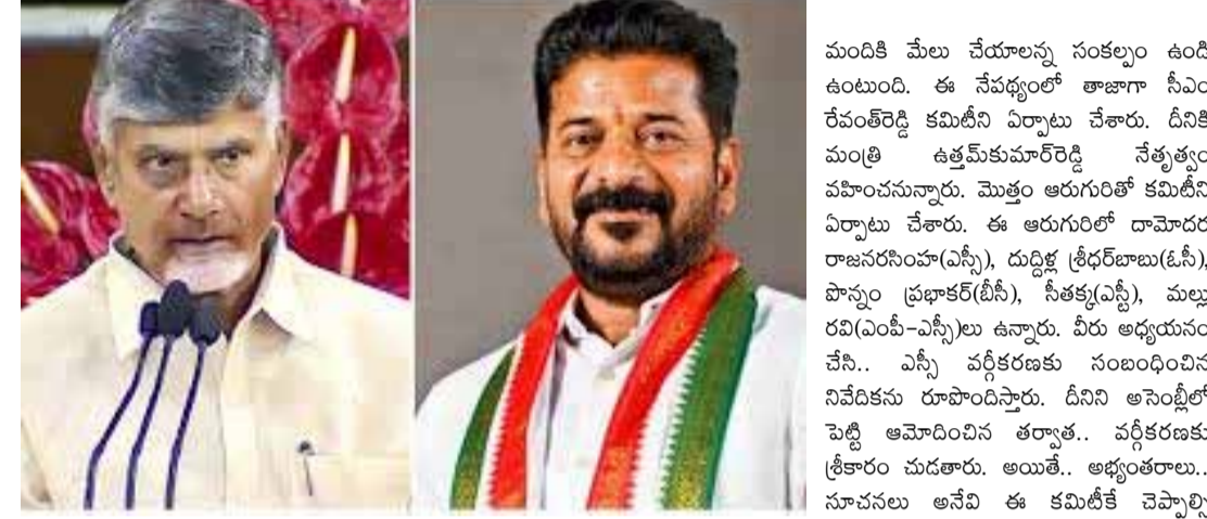
రాష్ట్రాన్ని యూనిట్ గా తీసుకుని వర్గీకరణ చేయాలని భావిస్తున్నారు. ఉంటుంది. అదేసమయంలో ఈ కమిటీ ఎస్సీ సంఘాల నాయకులతో తెలంగాణలో మాదిగ సమాజం ఎక్కువగా ఉన్నందున.. ఎక్కువ సమావేశాలు నిర్వహించి.. వారి అభిప్రాయాలను తెలుసుకుంటుంది.

అయితే.. ఎవరిని హోదించుకుంటూ జాగ్రత్తగా నిర్ణయాలు తీసుకోవాలని మాత్రం తేల్చి చెప్పింది. అన్ని వర్గాల సు ప్రాధాన్యం అంతంగా తీసుకుని.. వర్గీకరణ చేయాల్సి ఉందని పేర్కొంది. ఇదేసమయంలో రాజకీయ జోక్యానికి తావు ఉండరాదని కూడా స్పష్టం చేసింది. ఇదేసమయంలో తేడావస్తే.. తాము నేతృత్వం చేసుకుంటామని కూడా సుప్రీంకోర్టు తేల్చి చెప్పింది. ఈ నేపథ్యంలో ఏపీ ప్రభుత్వం దీనిపై అధ్యయనం చేస్తోంది. ఎలా వర్గీకరించాలన్న విషయం పై ఏపీ సీఎం చంద్రబాబు ఒక నిర్ణయానికి వచ్చారు. జిల్లాలను యూనిట్ గా తీసుకుని ఏపీలో వర్గీకరణ చేయాలని భావిస్తున్నారు. దీనికి కారణం.. కొన్ని కొన్ని జిల్లాల్లో మాత్రం సామాజిక వర్గం ఎక్కువగా ఉంది. మరొకటి వోట్ల మాదిగలు ఎక్కువగా ఉన్నారు. దీంతో వారిలో ఎవరికి ఇబ్బందులు లేకుండా.. పుష్కలంగా ఉన్నట్లు ఉద్దేశంతో ఈ నిర్ణయం తీసుకున్నారు. అయితే.. ఇప్పుడు తెలంగాణ విషయానికి వస్తే.. సీఎం రేవంత్ రెడ్డి మరో నిర్ణయం తీసుకున్నారు.