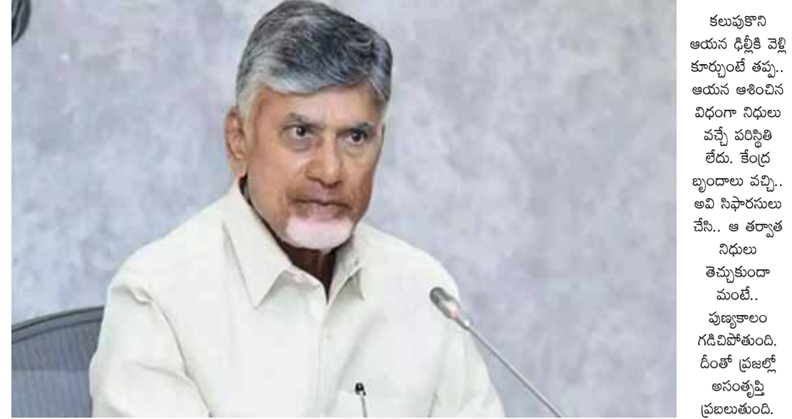
నిధులు సాధించాలని పరిశీలకులు చెబుతున్నారు. నిజానికి ఇప్పుడు చంద్రబాబు చేతిలో 15 మంది ఎంపీలు ఉన్నారు. మిత్రపక్షాలు జనసేనకు ఇద్దరు, బీజేపీకి నలుగురు ఎంపీలు ఉన్నారు. వీరందరినీ అప్పుడు ఎంత సాయం చేసినా.. పెద్దది విరుపులే కనిపిస్తాయి. కాబట్టి.. చంద్రబాబు గేర్ తో పాటు వ్యూహం ఆచూకా మార్చుకుంటే పని జరుగుతుందని అంటున్నారు పరిశీలకులు.