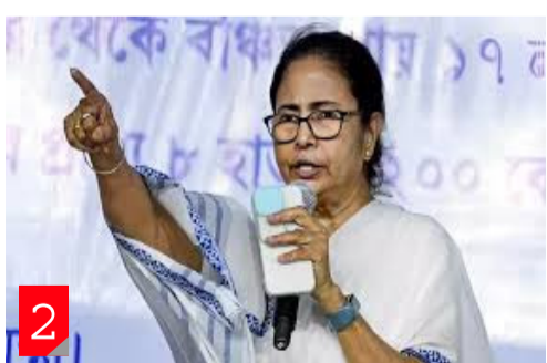
ఆర్ జీ కర్ మెడికల్ కాలేజీ ఆసుపత్రిలో పోస్ట్ గ్రాడ్యుయేషన్ ట్రైయిని వైద్యురాలు హత్యాచార ఘటన నేపథ్యంలో పశ్చిమ బెంగాల్లో నిరసనలు వెల్లువెత్తాయి. అవి నేటికీ కొనసాగుతున్నాయి. ఈ నేపథ్యంలో నిరసనల నుంచి దుర్గా పూజల వైపు దృష్టి మరలించాలంటూ పశ్చిమ బెంగాల్ ప్రజలకు సీఎం మమతా ఔన్సర్ల సూచించారు. కోల్కతా, సెప్టెంబర్ 10: ఆర్ జీ కర్ మెడికల్ కాలేజీ ఆసుపత్రిలో పోస్ట్ గ్రాడ్యుయేషన్ ట్రైయిని వైద్యురాలు హత్యాచార ఘటన నేపథ్యంలో పశ్చిమ బెంగాల్లో నిరసనలు వెల్లువెత్తాయి. అవి నేటికీ కొనసాగుతున్నాయి. ఈ నేపథ్యంలో నిరసనల నుంచి దుర్గా పూజల వైపు దృష్టి మరలించాలంటూ పశ్చిమ బెంగాల్ ప్రజలకు సీఎం మమతా ఔన్సర్ల సూచించారు.

సీఎం మమత వ్యాఖ్యలపై ఘాటుగా స్పందించిన హత్యాచార వైద్యురాలి తల్లి సీఎం మమత వ్యాఖ్యలపై స్పందించిన మృతురాలి తల్లి.. భవిష్యత్తులో కుమార్తెతో కలిసి పూజలు చేసుకోలేం.. యూఎస్ పర్యటనలో మళ్లీ కీలక వ్యాఖ్యలు