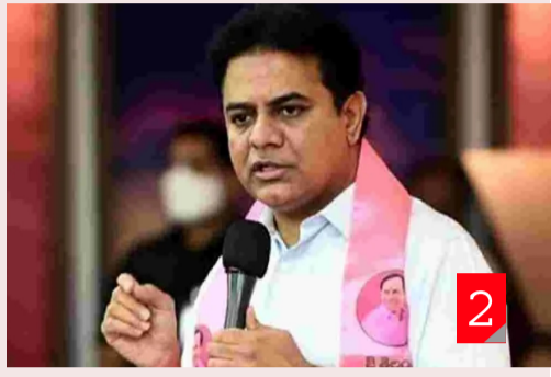
హైదరాబాద్: స్వాతంత్ర్య భారతదేశంలోనే రైతు రుణమాఫీ పేరుతో కాంగ్రెస్ అతి పెద్ద మోసం చేసిందని బీఆర్ఎస్ వ్యంగం

499మంది రైతులు ఉండగా.. ఏ ఒక్కరికీ రుణమాఫీ కాకపోవటం దారుణమంటూ కాంగ్రెస్ గ్రామ రైతులకు ఎందుకు మాఫీ కాలేదో సమాధానం చెప్పాలని డిమాండ్ చేశారు.