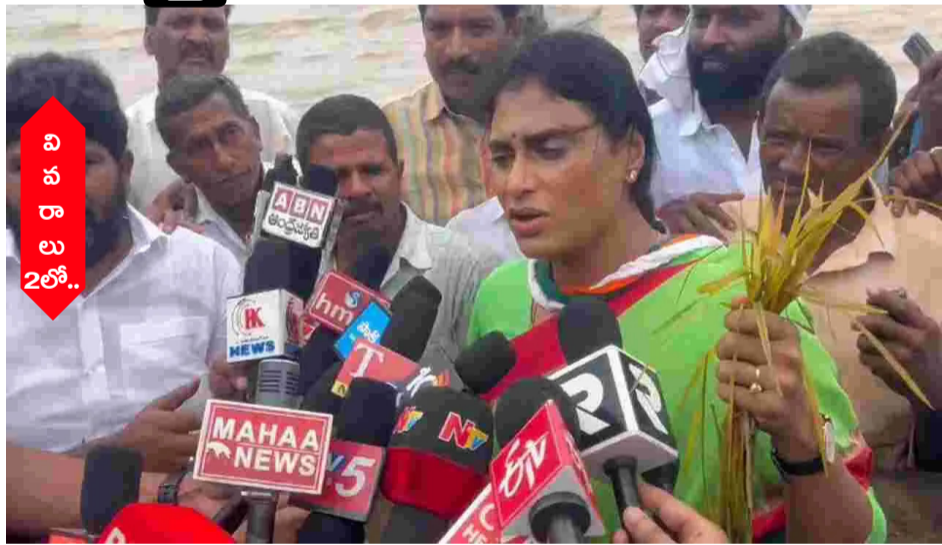
విజయవాడ: ఆంధ్రప్రదేశ్లో భారీ వర్షాల వల్ల అధికంగా వైవీ పర్షల్ ఆరోపణలు చేశారు. ప్రధానమంత్రి నరేంద్ర మోదీ మోసం చేశారని ఏపీ కాంగ్రెస్ ముఖ్యమంత్రి నారా చంద్రబాబునాయుడు ఢిల్లీ వెళ్లి సాయం

50 మంది వరదలతో వ్రాణాలు కోల్పోయారని ఆవేదన వ్యక్తం చేశారు. రూ. 6, 888 కోట్ల నష్టం జరిగిందని సీఎం చంద్రబాబు చెప్పారని గుర్తుచేశారు. ఏపీకి ఒరిగిందేమీ లేదని షల్కల విమర్శలు చేశారు. భారీ వర్షాలకు ఇంట్లో సామాన్లు కూడా ఒక్కటి మిగిలేదని చెప్పారు. వరద బాధిత కుటుంబాలకు లక్ష రూపాయల చొప్పున సహాయం అందజేయాలని షల్కల డిమాండ్