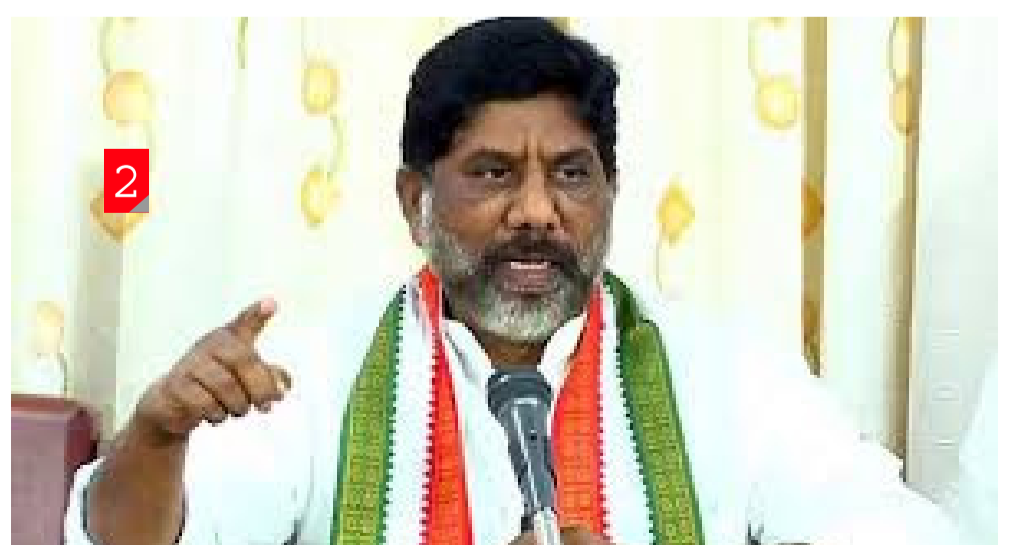
హైదరాబాద్: తెలంగాణ ఆర్థిక అభివృద్ధికి కేంద్ర ప్రభుత్వం వెంటనే సహాయం అందజేయాలని ఆర్థిక మంత్రి, తెలంగాణ డిప్యూటీ సీఎం మల్ల భట్టి విక్రమార్క, కీరారు. పన్నుల నుంచి రాష్ట్రానికి వచ్చే ఆదాయం వాటాను 41 శాతానికి నుంచి 50 శాతానికి కేంద్రం పెంచాలని ఆడిగాడు. ప్రజా భవన్లో 16వ ఆర్థిక సభ్యం సమావేశం ఈరోజు(మంగళవారం) జరిగింది.

రైతు భరోసా, రైతు రుణమాఫీ రాష్ట్రానికి జీవరేఖ లాంటివని మంత్రి రూ. 6.85 లక్షల కోట్లకు పైగా రుణభారంతో రాష్ట్రం సతమతం రాష్ట్రాలకు వాటా ఇవ్వాలని కేంద్ర ప్రభుత్వాన్ని డిమాండ్ చేశారు. తలసరి ఆదాయం ఎక్కువ ఉన్నప్పటికీ సంపద, ఆదాయంలో భారీ తేడా ఉందని అన్నారు.