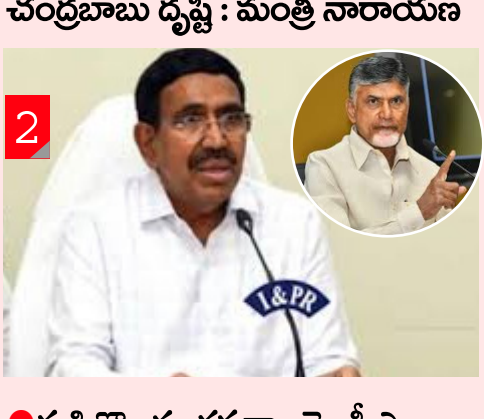
రుషికొండ భవనాలపై సీఎం చంద్రబాబు దృష్టి : మంత్రి నారాయణ