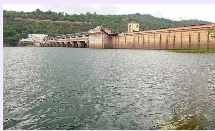
శ్రీశైలం రిజర్వాయర్లో పూర్తిస్థాయి నీటిమట్టం 269.748 మీటర్లకు గాను ప్రస్తుతం 269.26 మీటర్లకు నీరు నిల్వ ఉంది. నిలువ సామర్థ్యం 215.81 టీఎంసీలకు గాను 210.03 టీఎంసీల వరకు నీరు ఉందని అధికారులు వివరించారు

అమరావతి : సంద్యాల జిల్లా శ్రీశైలం రిజర్వాయర్ కు వరద ఉద్ధృతి కొనసాగుతుంది. కృష్ణా నదికి ఎగువ భాగంలో అధిక వర్షాలు కురుస్తుండడంతో సుంకేపల్లి, జూరాల ప్రాజెక్టుల నుంచి అధికారులు నీటిని గువకు విడుదల చేస్తున్నారు. దీంతో శ్రీశైలంకు భారీగా వరద ప్రవాహం వస్తుంది. లక్షా 05, 721 క్యూసెక్కుల నీరు రిజర్వాయర్ కు వస్తుండగా 1,03,026 క్యూసెక్కుల నీటిని నాగార్జునసాగర్ కు విడుదల చేస్తున్నారు.