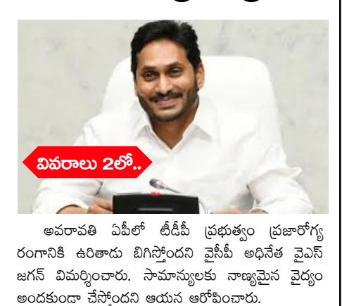
అమరావతి ఏపీలో టీడీపీ ప్రభుత్వం ప్రజారోగ్య రంగానికి ఉరితాడు బిగిస్తోందని వైసీపీ అధినేత వైఎస్ జగన్ విమర్శించారు. సామాన్యులకు నాణ్యమైన వైద్యం అందకుండా చేస్తోందని ఆయన ఆరోపించారు.