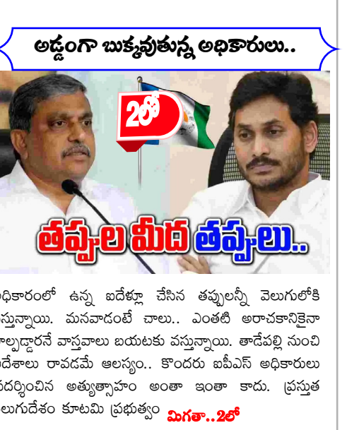
అడ్డంగా బుక్కవుతున్న అధికారులు..

అధికారంలో ఉన్న ఐదేళ్లూ చేసిన తప్పులన్నీ వెలుగులోకి వస్తున్నాయి. కూటమి ప్రభుత్వం గత ప్రభుత్వ అరాచకాలపై పూర్తిగా ఫోకస్ ప్రభుత్వం దృష్టిసాలిస్తే ఇంకెన్ని ఘటనలు బయట పడతాయోనన్న చర్చ వైసీపీ అరాచకాలు తవ్వకొట్టి బయటపడుతున్నాయి.