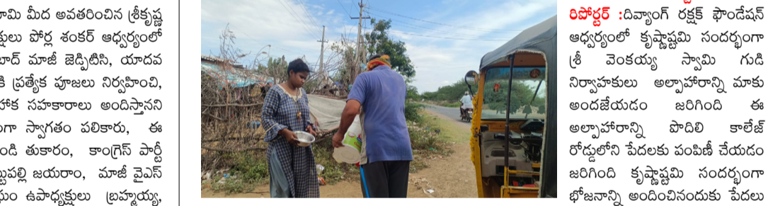
తమ సంతోషాన్ని వ్యక్తం చేశారు