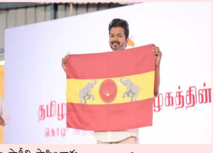
తమిళ సినీ పరిశ్రమలో అగ్ర హీరోగా కొనసాగుతున్న బిజయ్ ప్రత్యక్ష రాజకీయంలోకి అడుగుపెట్టిన సంగతి తెలిసిందే. తమిళనాడు వెళ్లి కళగం పేరుతో ఆయన రాజకీయ పార్టీని స్థాపించారు. విగతా..2లో

తమిళనాడు వెళ్లి కళగం పేరుతో పార్టీని స్థాపించిన బిజయ్ చెన్నైలో పార్టీ జెండాను ఆవిష్కరించిన బిజయ్