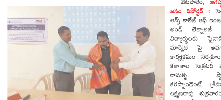
వేటపాలెం, అగస్టు 23 జనం రిపోర్టర్ : సెయింట్ ఆన్స్ కాలేజ్ ఆఫ్ ఇంజనీరింగ్ అండ్ టెక్నాలజీ చీఫ్ అధికారి విద్యార్థులకు ఫైనాన్సియల్ మార్కెట్ పై అవగాహన కార్యక్రమం నిర్వహించినట్లు కళాశాల సెక్రటరీ వసంతరావు తెలిపారు. కరస్పాండెంట్ స్టేషనుల లక్షణాలపై శుభవారం ఒక కార్యక్రమం నిర్వహించారు. అనంతరం ఏం సాంబితులపాడు మాట్లాడుతూ భారతదేశంలో ఫైనాన్సియల్ మార్కెట్ పరిధి చాలా పెద్దదని దీని ద్వారా ప్రభుత్వానికి ట్యాక్స్ ల రూపంలో ఆదాయం సమకూరుతుందని తెలిపారు. స్టాక్ మార్కెట్లో ఎంతో మందికి ఉపాధి అవకాశాలు ఉన్నాయని ఆయనపై ఎంపీ విద్యార్థులకు స్టాక్ మార్కెట్, మ్యూచువల్ ఫండ్స్ గురించి పూర్తి అవగాహన కలిగి ఉండాలన్నారు. సీట్ మార్కెట్లో ఇన్వెస్ట్, సెక్యూరిటీల, హెడ్జ్, ఆర్బి ట్రేడర్ గురించి తెలిపి ఎ.వి.ఎస్.ఎం సెక్షన్లలో చిల్ల కలిగి ఉపయోగాలు గూర్చి తెలిపారు. కార్యక్రమంలో ఎంపీ ఆధ్యాపకులు విద్యార్థి విద్యార్థులు పాల్గొన్నారు.