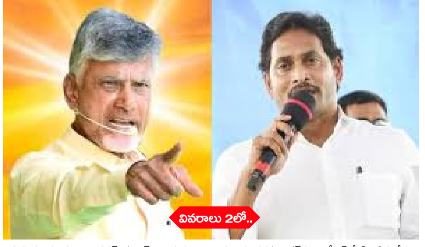
ఉన్నప్పుడు చంద్రబాబు, పవన్ కళ్యాణ్ పై విమర్శలు గుప్పించిన నేతలు ప్రస్తుతం స్వరం మార్చారు. పరిపాలనలో చంద్రబాబు ఎంతో అనుభవం ఉన్న నాయకుడంటూ ప్రశంసలు కురిపిస్తున్నారు. ఎన్నికల ముందు వరకు జగన్ ను ఓ రేంజీలో పొగడిన నేతలు ఇప్పుడు ఆయనపై ఆగ్రహంగా ఉన్నారు. కొందరు నేతలైతే జగన్ కు గుడ్ బై చెప్పి రాజకీయాలకు దూరంగా ఉంటే.. విగత..2లో