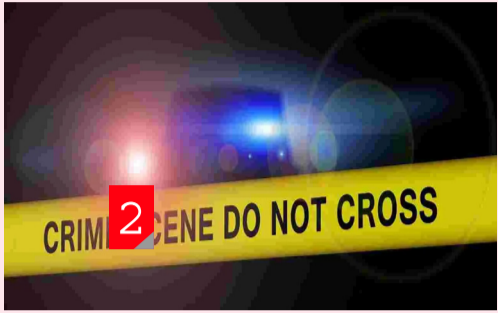
కోల్కతా, ఆగస్టు 21: పశ్చిమ బెంగాల్ రాజధాని కోల్కతాలో హార్టర్ సీన్స్ ఒకదాని తర్వాత ఒకటి కొనసాగుతున్నాయి. ఇప్పటికే ఆర్ జీ కార్ మెడికల్ కాలేజీ ఆసుపత్రిలో పోస్ట్ గ్రాడ్యుయేషన్ విగత..2లో

వైద్యులాలిపై హత్యాచార ఘటనతో దేశవ్యాప్తంగా ఆందోళనలు కొనసాగుతున్నాయి. దేశవ్యాప్తంగా వైద్య సిబ్బంది ముకుమ్మడి ఆందోళనకు దిగారు.