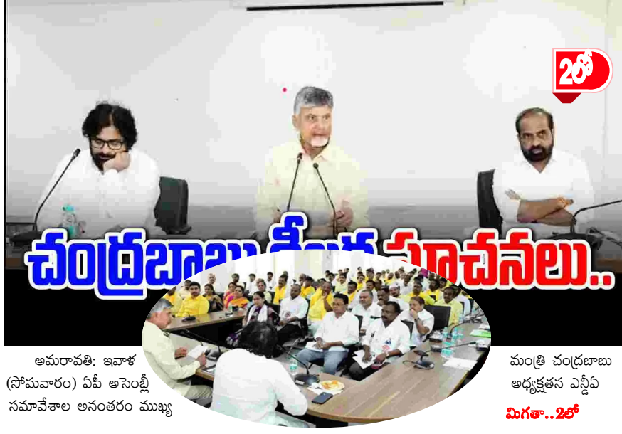
అమరావతి: ఇవాళ (సోమవారం) ఏపీ అసెంబ్లీ సమావేశాల ఆనంతరం ముఖ్య

భద్రాచలం వద్ద పెరిగిన నీటి మట్టం.. ● భారీగా వరద వస్తుండటంతో రెండో ప్రమాద హెచ్చరిక జారీ అయింది. ● భద్రాచలం వద్ద గోదావరి నీటిమట్టం 48 అడుగులకు చేరింది ● భద్రాచలం వద్ద గోదావరి నది ఉధృతంగా ప్రవహిస్తున్నది. ● ఎగువన ఎడతెరపి లేకుండా వర్షాలు కురుస్తుండటంతో నది ఉగ్రరూపం దాల్చింది. భద్రాచలం వద్ద గోదావరి నది ఉధృతంగా ప్రవహిస్తున్నది. ఎగువ నుంచి భారీగా వరద వస్తుండటంతో రెండో ప్రమాద హెచ్చరిక జారీ అయింది. భద్రాచలం వద్ద గోదావరి నీటిమట్టం 48 అడుగులకు చేరింది.